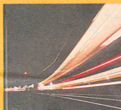
Offizieller Jubiläumsband der Deutschen Bundesbahn 150 Jahre Deutsche Eisenbahnen

Über den Eisenbahn-Bestseller des Jahres 1985/86 viel zu schreiben, hieße die sprichwörtlichen „Eulen nach Athen“ tragen... wer diesen außergewöhnlichen Prachtband noch nicht sein Eigen nennt, sollte nicht länger zögern! Erscheint nur alle 50 Jahre ★ Wertsteigerungen nicht ausgeschlossen (Manche kauften schon mehrere Exemplare auf Vorrat!) ★ Greifen Sie zu!