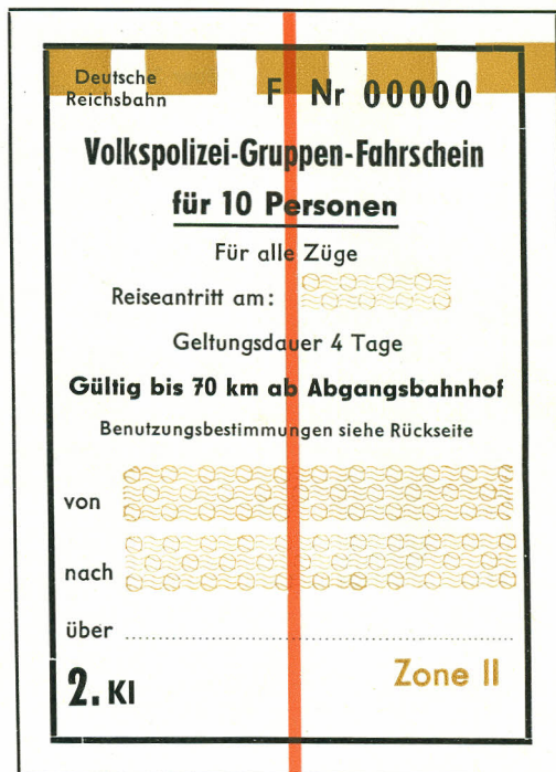
1. Klasse Kennfarbe grün