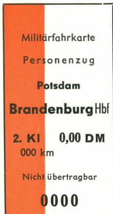
a) einfache Fahrt