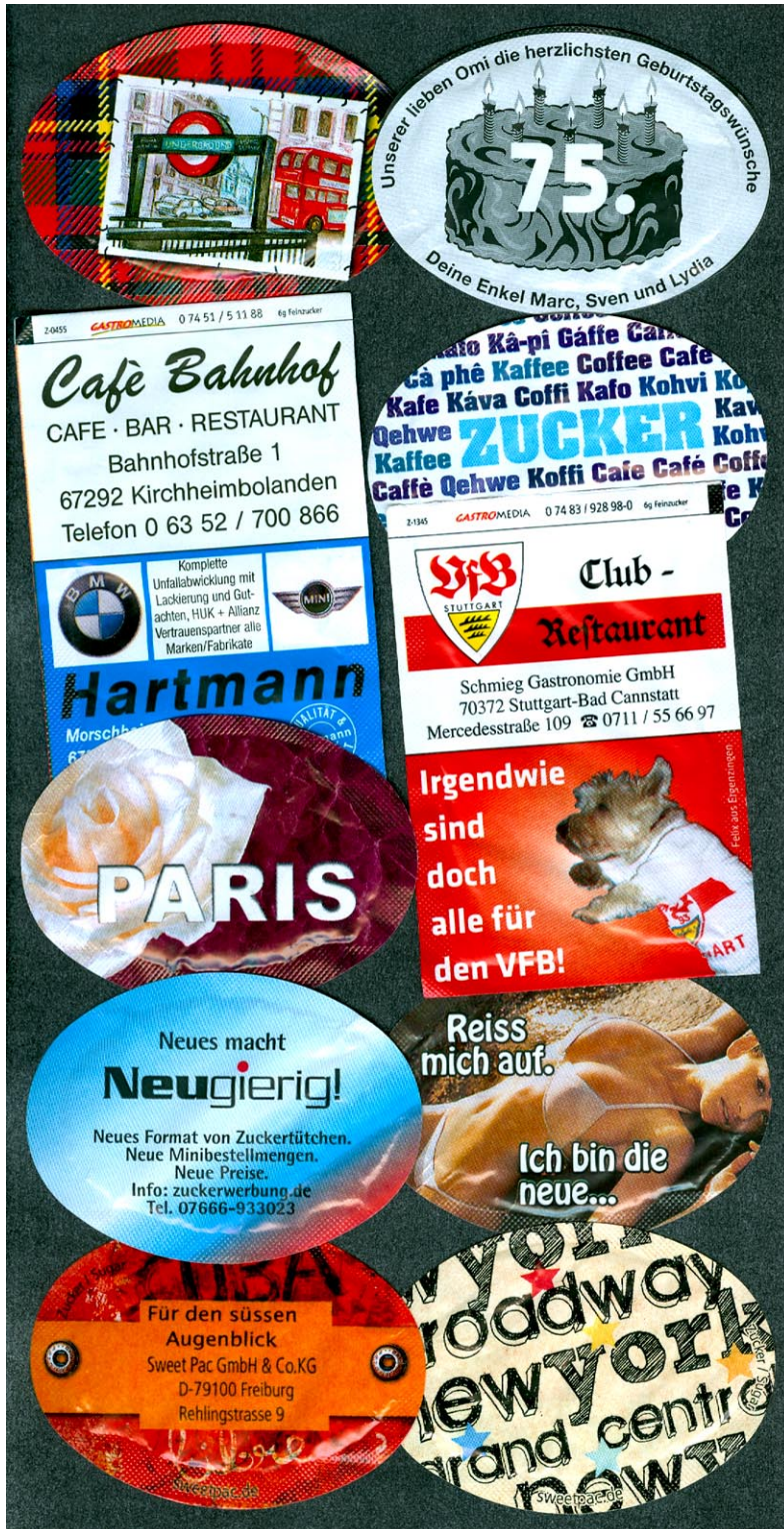
Werbung auf Zucker-Tütchen: Hinweise auf neue Serien. Siehe Seite 11

Der Zuckersammler-Klub Deutschlands & Freunde